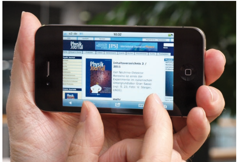
Multi-Touch macht's möglich: Mit dem Spreizen zweier Finger kann der Nutzer

Das zentrale Element eines solchen intuitiv bedienbaren Smartphones ist sein Bildschirm, der Eingabegerät, Sensor und Ausgabemedium in einem ist. Er besteht aus einem Dünnschicht-Transistor-Display, über dem sich ein Touchscreen befindet. Die meisten Fabrikate nutzen ein kapazitives Verfahren, um die Bedienung mit den Fingern in elektrische Signale umzuwandeln. Der Touchscreen besteht dazu aus vier Lagen: einer dünnen Deckschicht zum Schutz vor Umwelteinflüssen – Glas ist die hochwertigste Lösung – sowie zwei durchsichtigen Dünnschichtleiterplatten, oft aus Indiumzinnoxid, zwischen denen sich eine nicht leitfähige, transparente dünne Trennschicht befindet. Die beiden Leiterplatten wirken wie ein Kondensator, dessen Feldstärke sich ändert, wenn